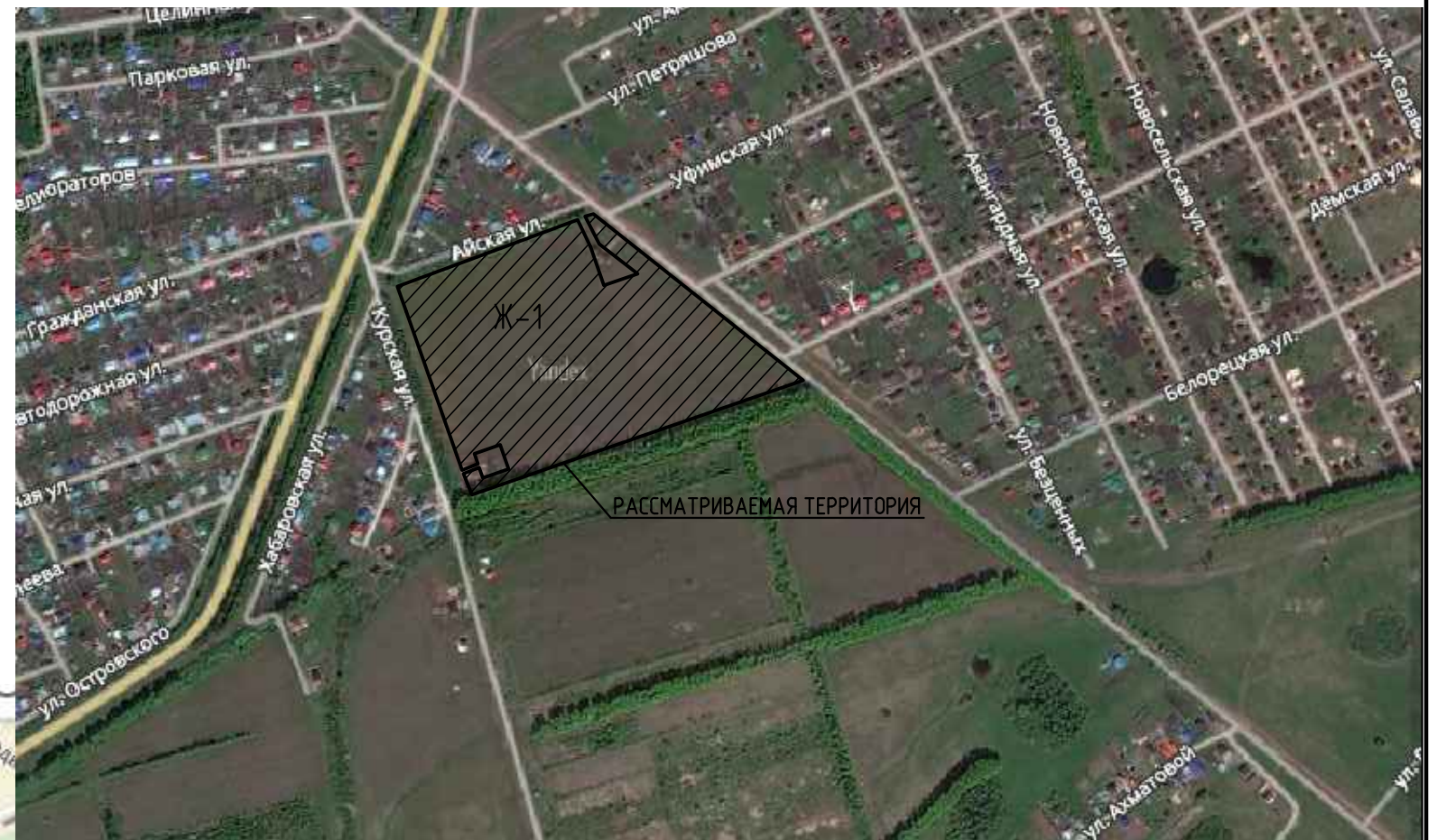
Схема расположения элемента планировочной структуры