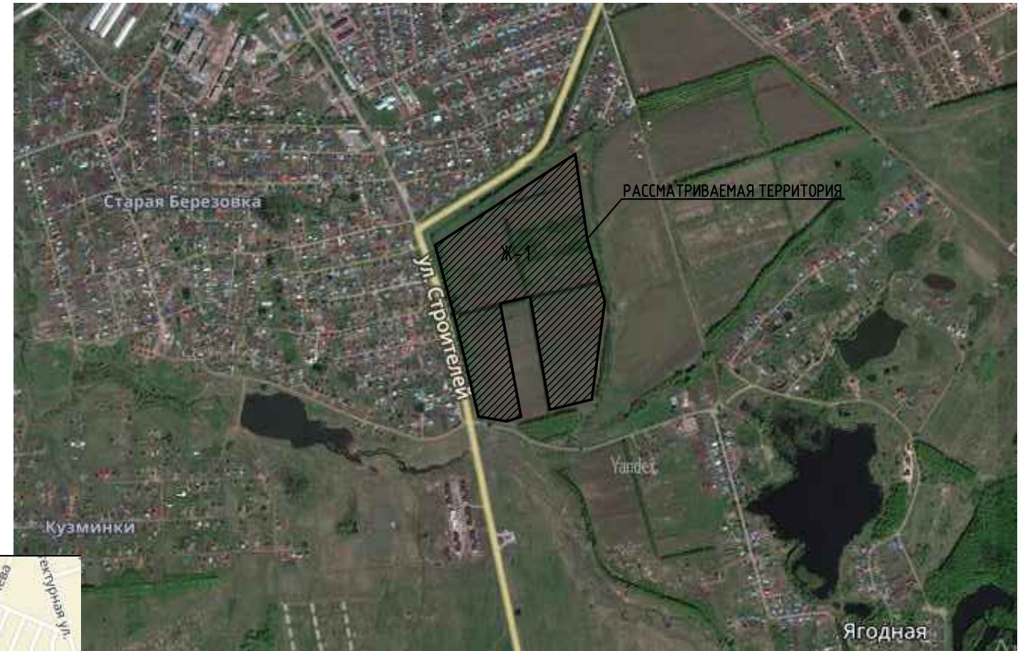
Схема обслуживания населения